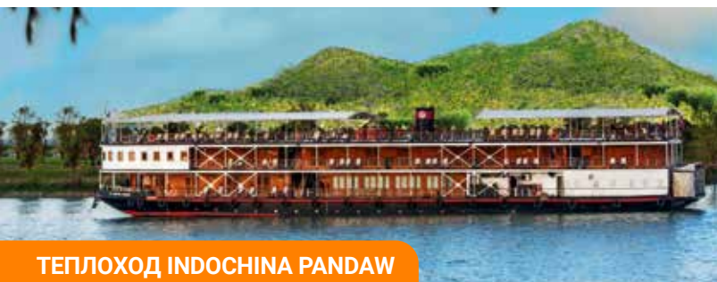
ТЕПЛОХОД INDOCHINA PANDAW

За 15 дней путешествия почувствуйте самобытность Юго-Восточной Азии, погрузитесь в её историю и культуру в атмосфере круиза на комфортабельном теплоходе, который на время круиза будут исключительно в распоряжении гостей «Созвездия».